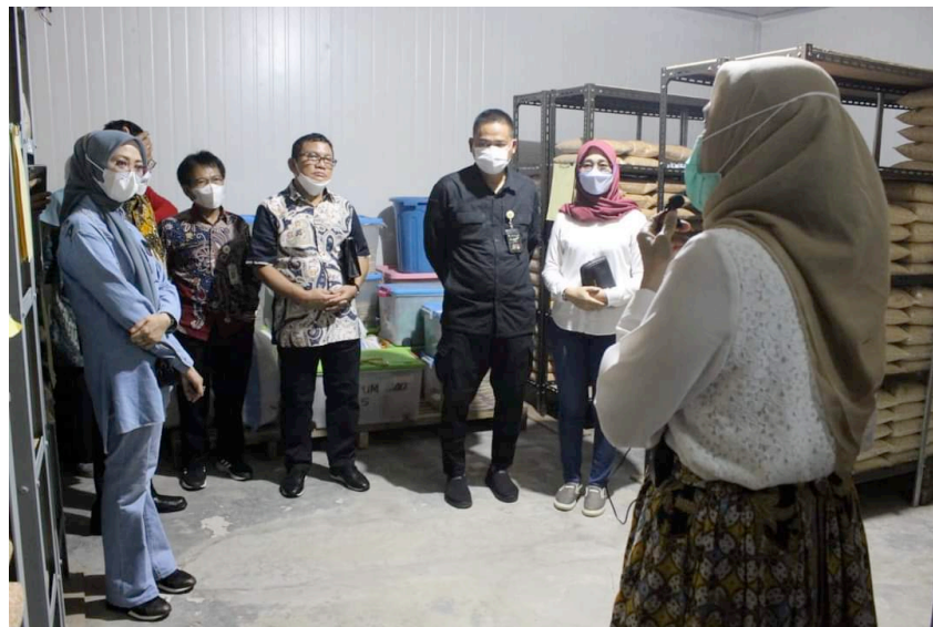
Gambar 11. Kunjungan DPR-RI pada Pelayanan Informasi Benih/UPBS