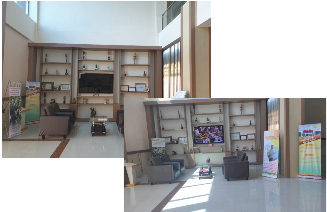
Gambar 9. Layar informasi teknologi serealia

Selain ruang pelayanan publik untuk layanan informasi, guna mendukung pemberian layanan yang nyaman bagi pengguna jasa layanan balitsereal seperti layanan UPBS maupun layanan laboratorium berbagai fasilitas juga telah disediakan seperti ruang tamu untuk layanan Lab dan ruang tamu untuk layanan UPBS. Display benih berbagai varietas unggul balitsereal serta berbagai informasi produk inovasi balitsereal yang telah dihasilkan Balitsereal juga ditampilkan di ruang tunggu /ruang tamu.