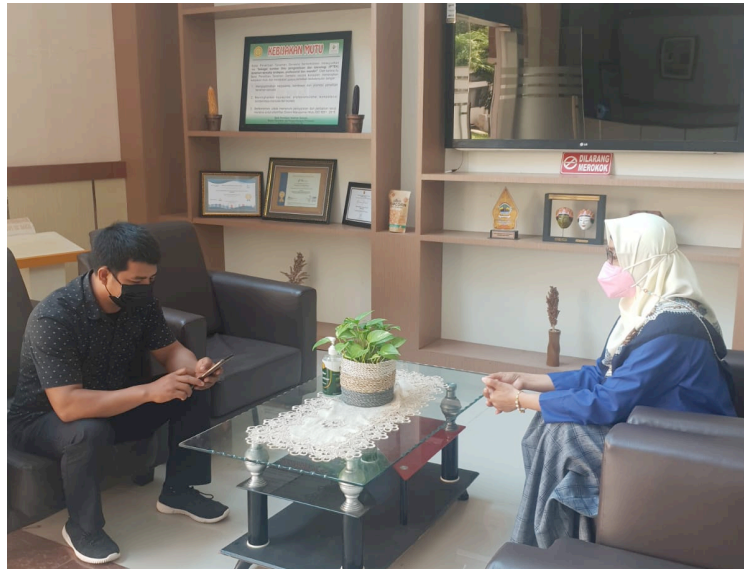
Gambar 7. Penerimaan Tamu oleh Koordinator Substansi Jasa Penelitian