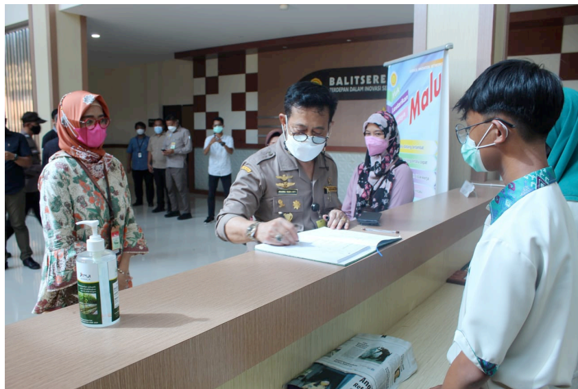
Gambar 13. Front Desk Ruang Lobi Kantor Balitsereal