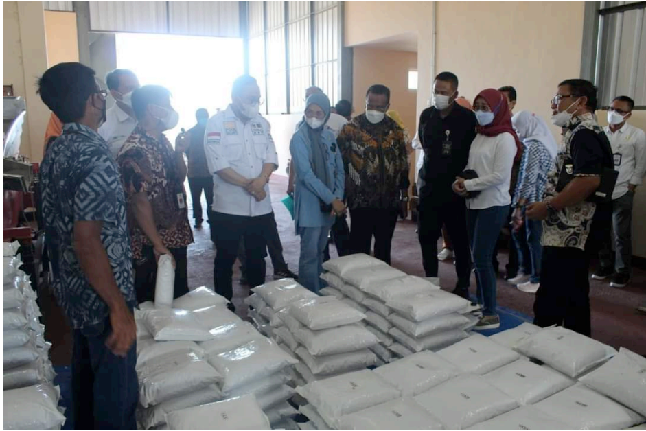
Gambar 12. Kunjungan DPR RI pada Gudang Penyimpanan Benih Balitsereal