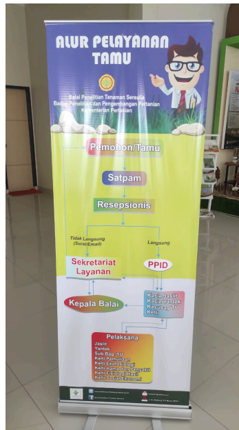
Gambar 4. Prosedur Permohonan Informasi Publik Balitsereal

Sehubungan dengan keterbatasan SDM dan padatnya tugas, Balitsereal menempatkan beberapa siswa pada counter layanan publik yang sebelumnya mendapat pengarahan terlebih dahulu mengenai tugas yang akan dilakukan sebagai resepsionist penerimaan tamu/pengunjung.