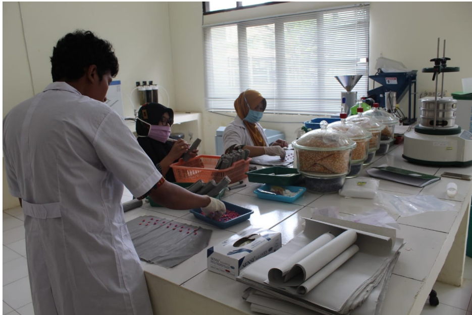
Gambar 10. Pelayanan Laboratorium Pengujian Mutu Benih