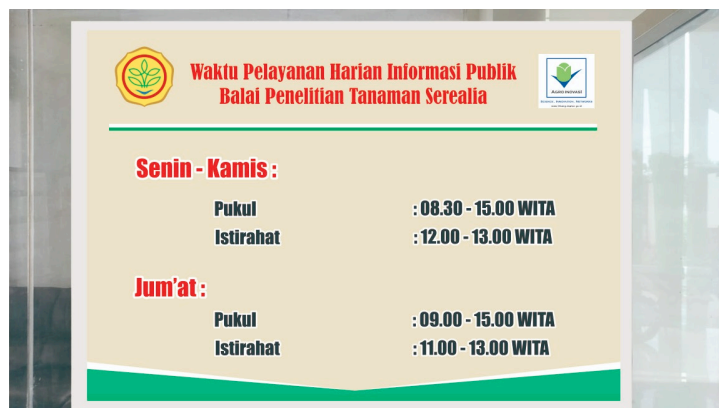
Gambar 2. Waktu Jam Pelayanan Informasi Publik Balitsereal