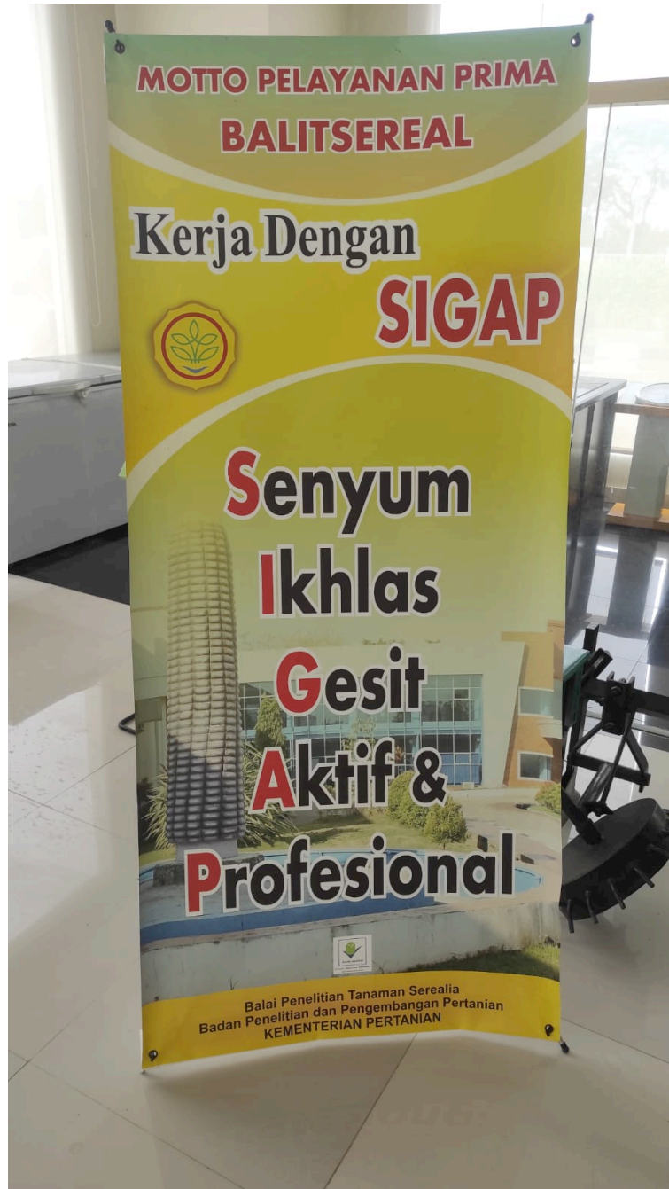
Gambar 1. Motto Pelayanan Prima Balai Penelitian Tanaman Serealia