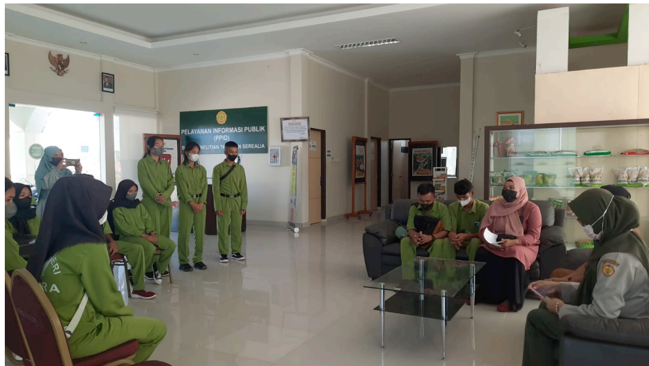
Gambar 8. Penerimaan Kunjungan Siswa SMKN Luwu Utara