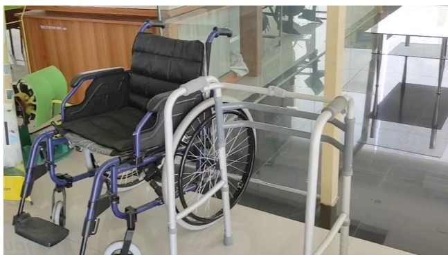
Gambar 6. Kursi Roda dan Alat Bantu Jalan bagi Pengunjung Disabilitas