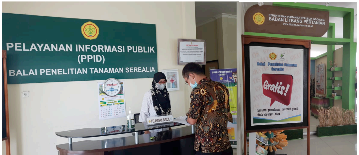
Gambar 3. Layanan Permohonan Informasi Publik Balitsereal tidak Dipungut Biaya

Layanan permohonan informasi publik Balitsereal tidak dipungut biaya.